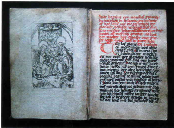
St. Anna te Drieën. Pentekening in een kartuizer handschrift. Maastricht, Bisschoppelijk Museum.