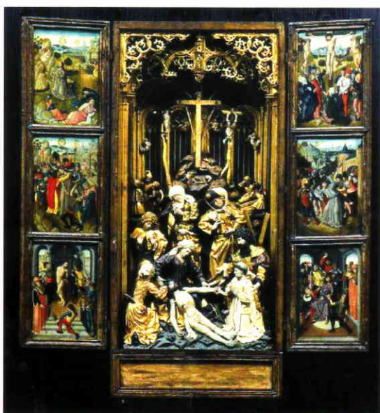
Meester Arnt (Beeldsnider) van Kalkar, Bewening, rond 1480, eikenhout 97 x 45 cm. Parijs, Musée de Cluny, Cl. 3269.

Wanneer Andreas hier als naamheilige fungeert kunnen we zoeken naar Roermondse kartuizers met de naam Andreas. Het is helaas onduidelijk wie de beschermheilige op de Amsterdamse beeldengroep is. In het kader van de tentoonstelling zal nader onderzoek worden verricht naar de identiteit van deze opdrachtgevers. De twee beeldengroepen worden omschreven als een huisaltaar en zouden daarom afkomstig kunnen zijn uit de kluisen van de monniken waar ze dan als altaar hebben gefunctioneerd. De beeldengroep in Parijs bevindt zich namelijk in een kast die aan de onderzijde een lade bevat waarin de benodigdheden voor de mis werden bewaard. Twee beschilderde luiken met voorstellingen uit het leven van Christus sluiten de kast af. De Amsterdamse beeldengroep bevond zich hoogst waarschijnlijk eveneens in een altaarkast. In de berg achter de Beweningsgroep bevinden zich drie gaten waarin zich de verloren gegane kruisen bevonden die nog wel zichtbaar zijn in de beeldengroep uit Parijs. De vraag