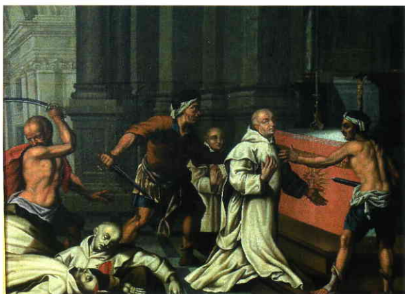
De Moord op de Roermondse kartuizers, olieverf op doek, achttiende eeuw. Roermond, Stedelijk Museum.

van Rijkel, één van de beroemdste leden van het Roermondse klooster, die niet minder dan 42 grote in quarto's vol schreef, maar desondanks toch de naam van 'Doctor extaticus' verdiende, bewijst juist het tegendeel. Zijn leven helemaal richten op de innerlijke mens wil niet zeggen dat men zich abstraheert van iedere activiteit; dat geeft ook niet aan dat men zonder ophouden de hele dag in gebed verzonken ligt.