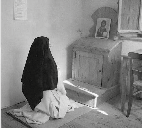
Kartuizerin in gebed.

maar vijf kloosters, waarvan twee in Zuid-Frankrijk (Aveyron en Provence), één in Noord-Italië (Ligurië), één in Spanje (Valencia) en één in Zuid-Korea. Tot voor kort waren er zes, maar tijdens het generale kapittel in 2013 werd besloten om het kartuizerinnenklooster van Vedana in de Italiaanse Dolomieten te sluiten, omdat de gemeenschap sterk verouderd en precair was geworden. De vrouwelijke tak van de kartuizerorde telt een zeventigtal leden, novicen inclusief. Dat kleine aantal beantwoordt wonderwel aan het ideaalbeeld dat Guigo I (1083-1136) in de Gewoonten van Chartreuse voor ogen had: “Eigenlijk heeft deze roeping geen aanbeveling nodig, want zij beveelt zichzelf voldoende aan door haar zeldzaamheid en het geringe aantal leden.” 2 Sint-Anna-ter-Woestijne in Brugge was het enige kartuizerinnenklooster ooit in de Lage Landen: hoewel het rond 1348 in Sint-Andries werd gesticht, verhuisden de monialen in 1580 naar de binnenstad. Het edict van keizer Jozef II om alle ‘nutteloze kloosters’ in de Oostenrijkse Nederlanden op te heffen, maakte in 1783 een definitief einde aan de geschiedenis van de Vlaamse kartuizerinnen. Vandaag resten nog slechts enkele gebouwen en de straatnaam Kartuizerinnenstraat als herinnering.