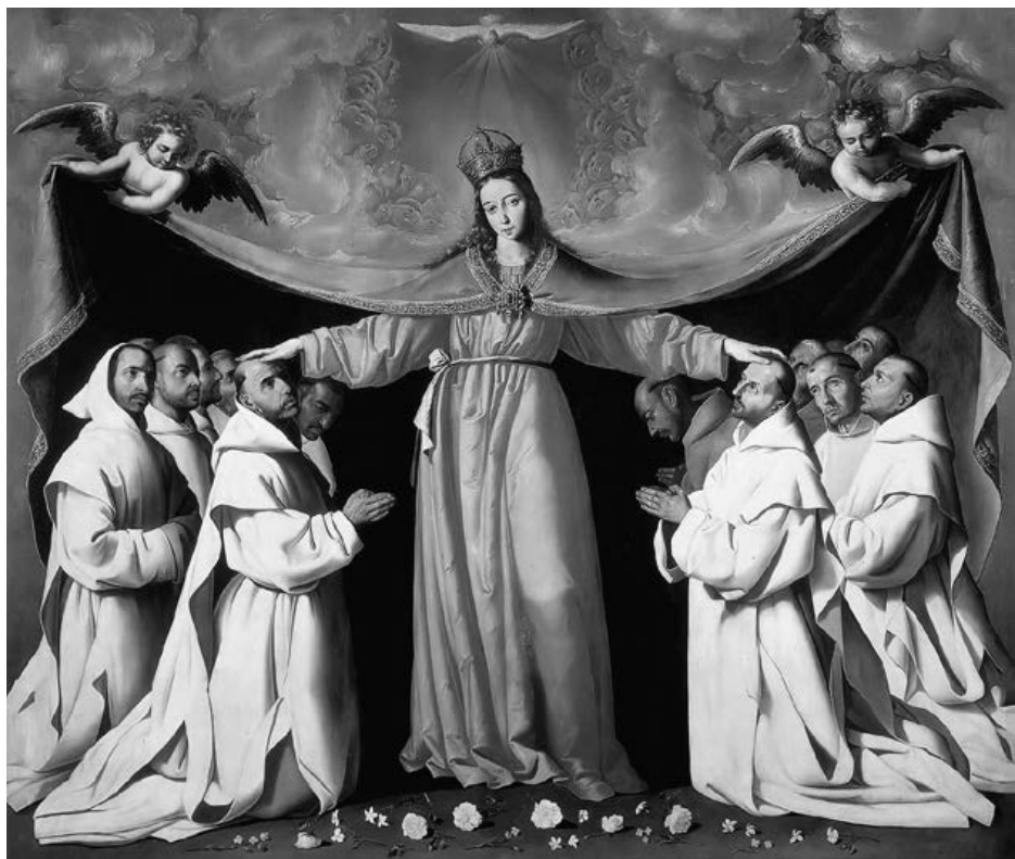
Francisco de Zurbarán, Regina Coeli met kartuizer monniken , olie op doek, ca. 1655, Sevilla.

vanaf 1333 mochten de monialen enkel nog intra muros wandelen. Hoewel dit voorschrift meermaals door de kartuizerinnen geamendeerd werd, bleven de toegevingen uiterst schaars: één supplementaire wandeling per week in de kloostertuin, maar dan wel alleen, staat in de eerste statuten. 7 Begin 20ste eeuw mochten geproteste monialen het klooster niet verlaten – zelfs niet voor eventjes – zonder een bijzonder indult van de Heilige Stoel op straffe van excommunicatie. 8 Thans is de wekelijkse wandeling buiten de kloostermuren een vertrouwde gewoonte. Meer nog, ook de jaarlijkse grand spaciement , een daguitstap met picknick, is een verworven recht van de kartuizerinnen van vandaag.