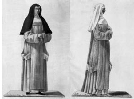
Kartuizerin, koormoniale en novice.

Een concreet voorbeeld van de vertragingsmanoeuvres door de mannen is de – in de Oude Statuten traceerbare – poging om een prior en een raad monniken aan het hoofd van elke vrouwencommunauteit aan te stellen. Na het radicale verzet van de monialen van Prébayon werd dit voorstel meteen weer afgevoerd. Het generale kapittel van 1280 bepaalde daarom dat alle monialen voortaan gehoorzaamheid zouden beloven aan hun priorin, die op haar beurt nauw moest samenwerken met de monnik-vicaris die in elk klooster woonde. Die vicaris nam de priesterlijke en liturgische taken op zich, zoals de eucharistie en de biecht. Een andere ferme stap in de goede richting was de aanpassing van het kartuizerinnenhabijt aan de mannelijke snit (1291), met name