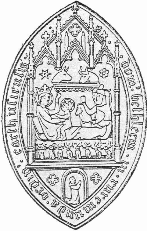
Laat-middeleeuws zegel van het Roermondse katuizerklooster met O.L. Vrouw van Bethlehem.